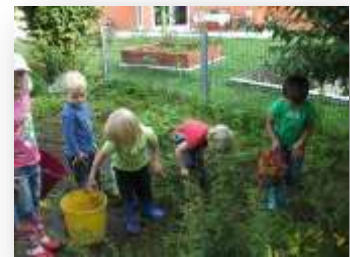
Entwicklungs- und Bildungsbereich: Gefühl und Mitgefühl