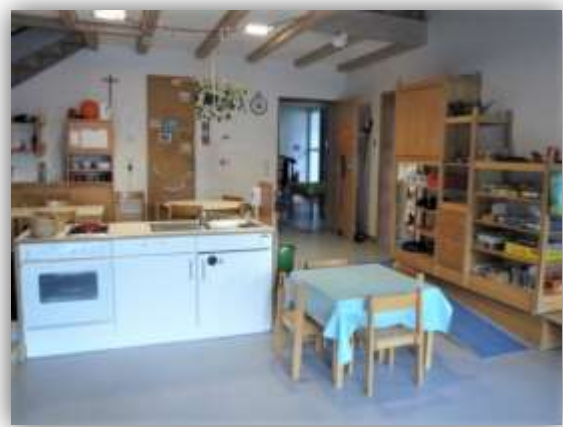
Gruppenraum mit Küchenzeile und Treppe

Neben dem Hauptraum befindet sich ein Nebenraum, der als Forscherraum, Bücherei oder Sinnesraum genutzt wird. Der Rollenspielraum gehört zum Zauberland, die Bücherei zum Bauland und der Ruheraum zum Spieleland. Jede Gruppe gestaltet diesen Raum individuell.