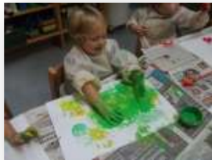
Entwicklungs- und Bildungsbereich: Sinne

Folgende Bildungs- und Entwicklungsbereiche aus dem Orientierungsplan werden in unserer Einrichtung umgesetzt: