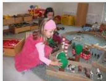
Entwicklungs- und Bildungsbereich: Denken