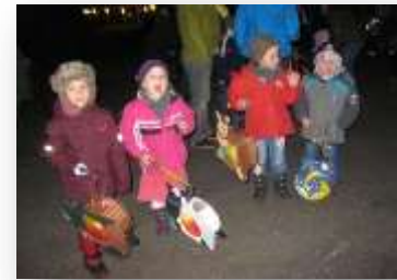
Entwicklungs- und Bildungsbereich: Sinn, Werte, Religion