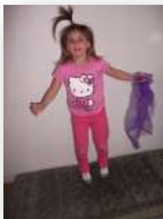
Entwicklungs- und Bildungsbereich: Körper