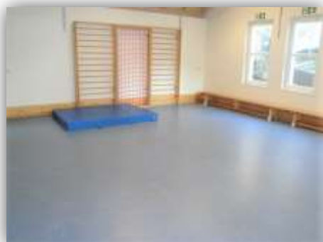
Turnhalle, Farbenland, Werkstatt

Jedem Gruppenraum ist ein weiterer Funktionsraum ( Werkstatt, Farbenland, Turnhalle ) zugeteilt, der während der Freispielzeit für die Kinder geöffnet ist. Die Zuständigkeit für diese Räume wechselt turnusmäßig.