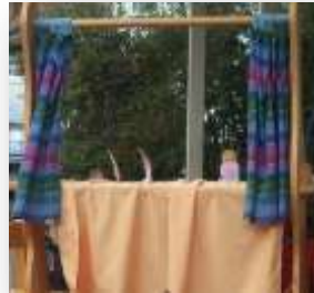
Entwicklungs- und Bildungsbereich: Sprache